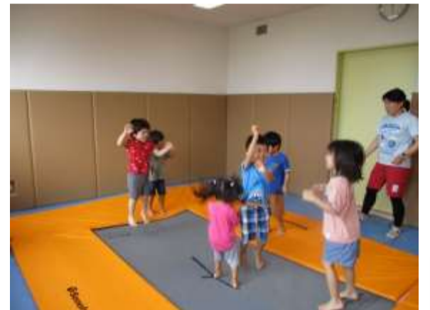
トランポリン 高くジャンプ