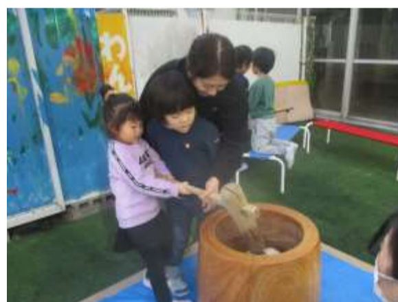
お餅つき ペったんこ