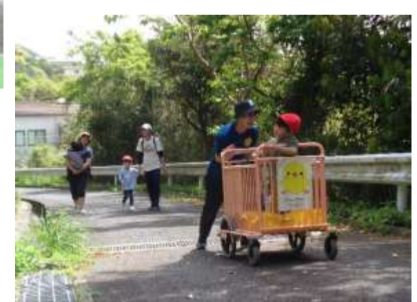
外遊び 裏山へ出発！