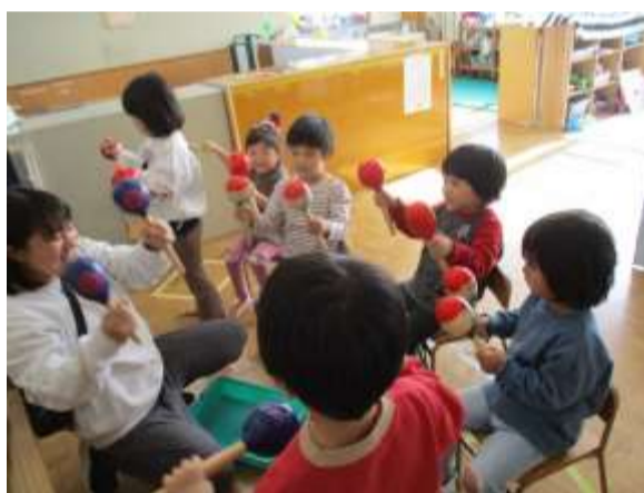
音楽遊び どんな音かな？