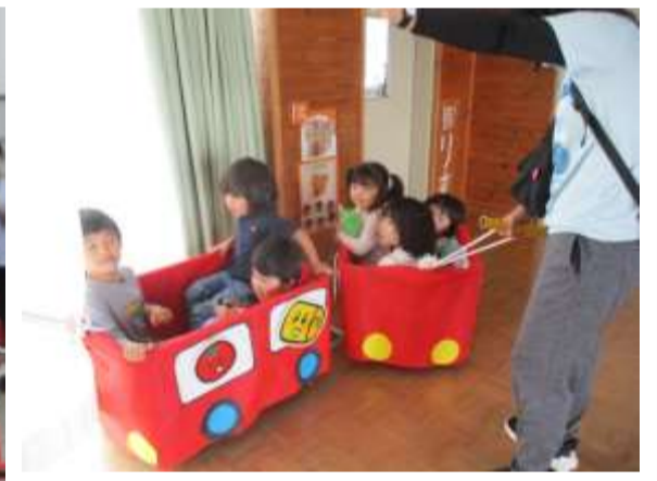
朝の遊び お弁当バス