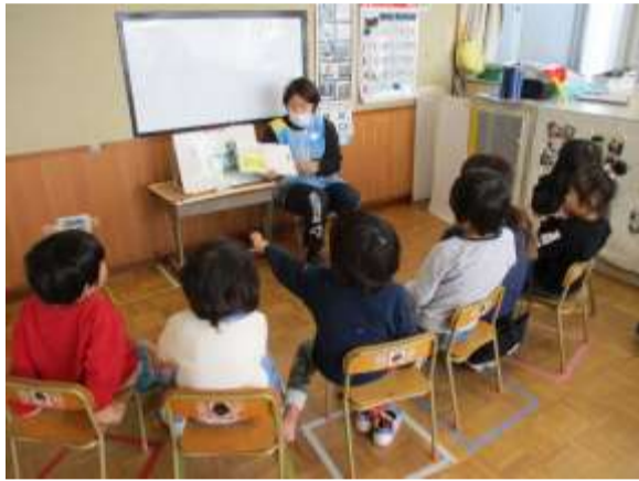
朝の集まり 絵本読み