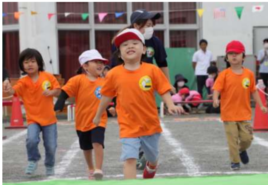
運動会 よーい、どん！