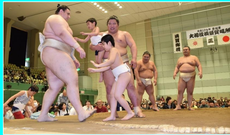
横須賀場所ちびっこ相撲に出たよ。（幼稚部、小学部）