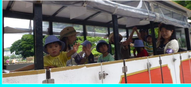
みんなで春の遠足（小学部）