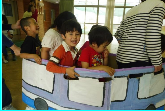
電車で遊ぼう（幼稚部）