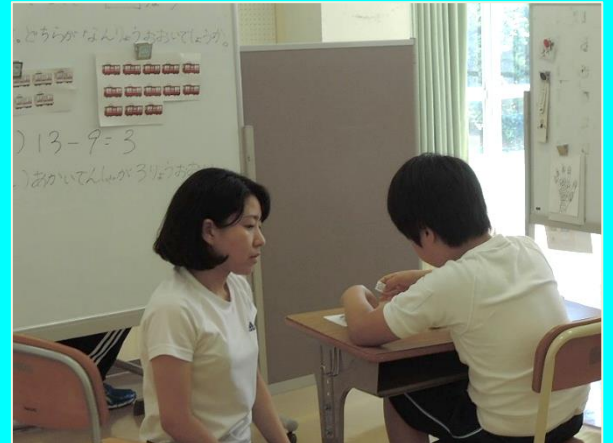
先生と1対1での学習（算数）（小学部）