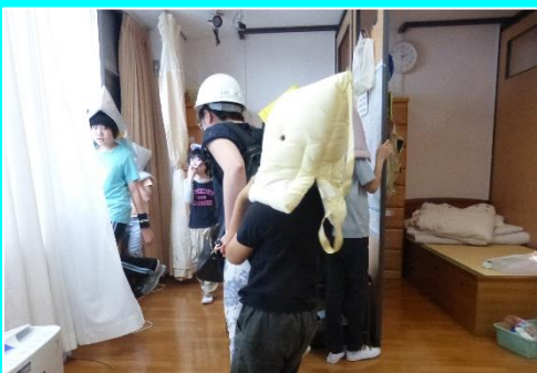
火災避難訓練（寄宿舎）