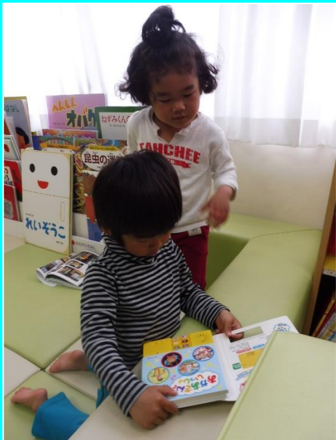
絵本は楽しいね。（幼稚部）