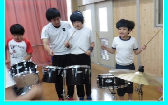
みんなで合わせて（音楽）（小学部）