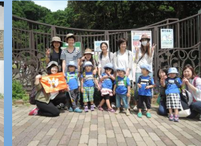
幼稚部 りす組(年中)