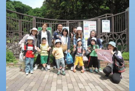
幼稚部 うさぎ組(年長)