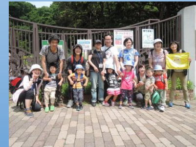
幼稚部 ひよこ組(年少)