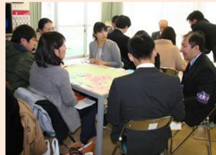
授業公開・授業研究会の様子