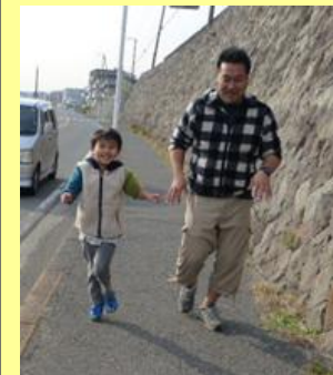
校内での練習の様子

今後も地域に参加できる児童の育成を目指し、大会に参加できるよう取り組んでいきたいと考えています。