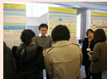
事例発表、ポスター発表の様子